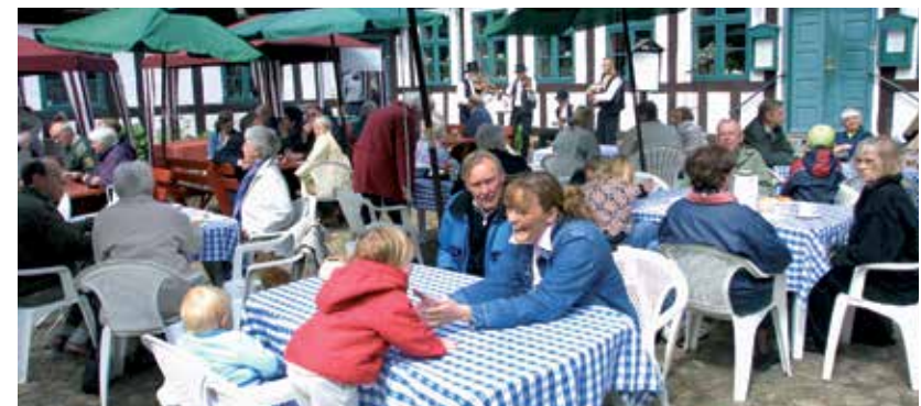
Man kan næsten mærke solen bage, høre spillemandenes musik og mærke de liflige dufte fra køkkenet fra mølledagen 2004.

Så det er en folkelig musikalsk indpakning, koncerterne har på Børkop Vandmølle.