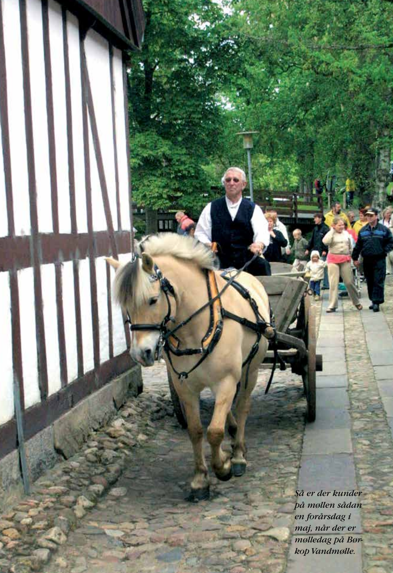
Så er der kunder på møllen sådan en forårsdag i maj, når der er mølledag på Børkop Vandmølle.

Mølledagene i Børkop er efterhånden legendariske og en tradition for mange familier i nær-området såvel som i hele regionen.