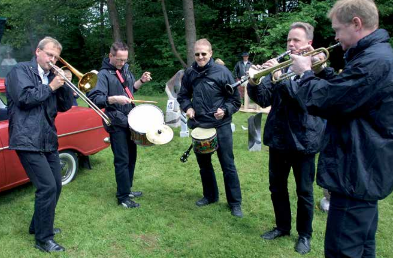
Neanders Jazzband på street parade ved mølledagen 2004 var en stor oplevelse for de mange mennesker, der nød samværret på Børkop Vandmølle.