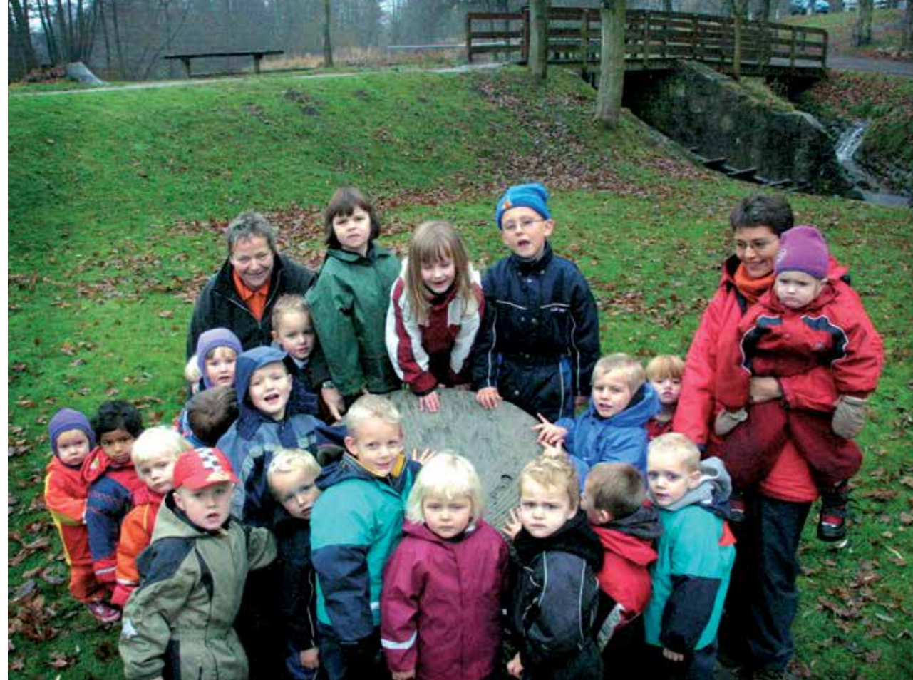
Lykkestenen - bliver her klappet af en flok børn, der her benter store portioner lykke til livet.

For siden møllen blev bygget om i 1813 har møllestenen drejet højre om.