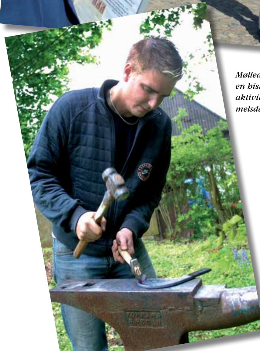
Mølledagen 2004 var en historisk dag med aktiviteter i god, gammeldags stil.