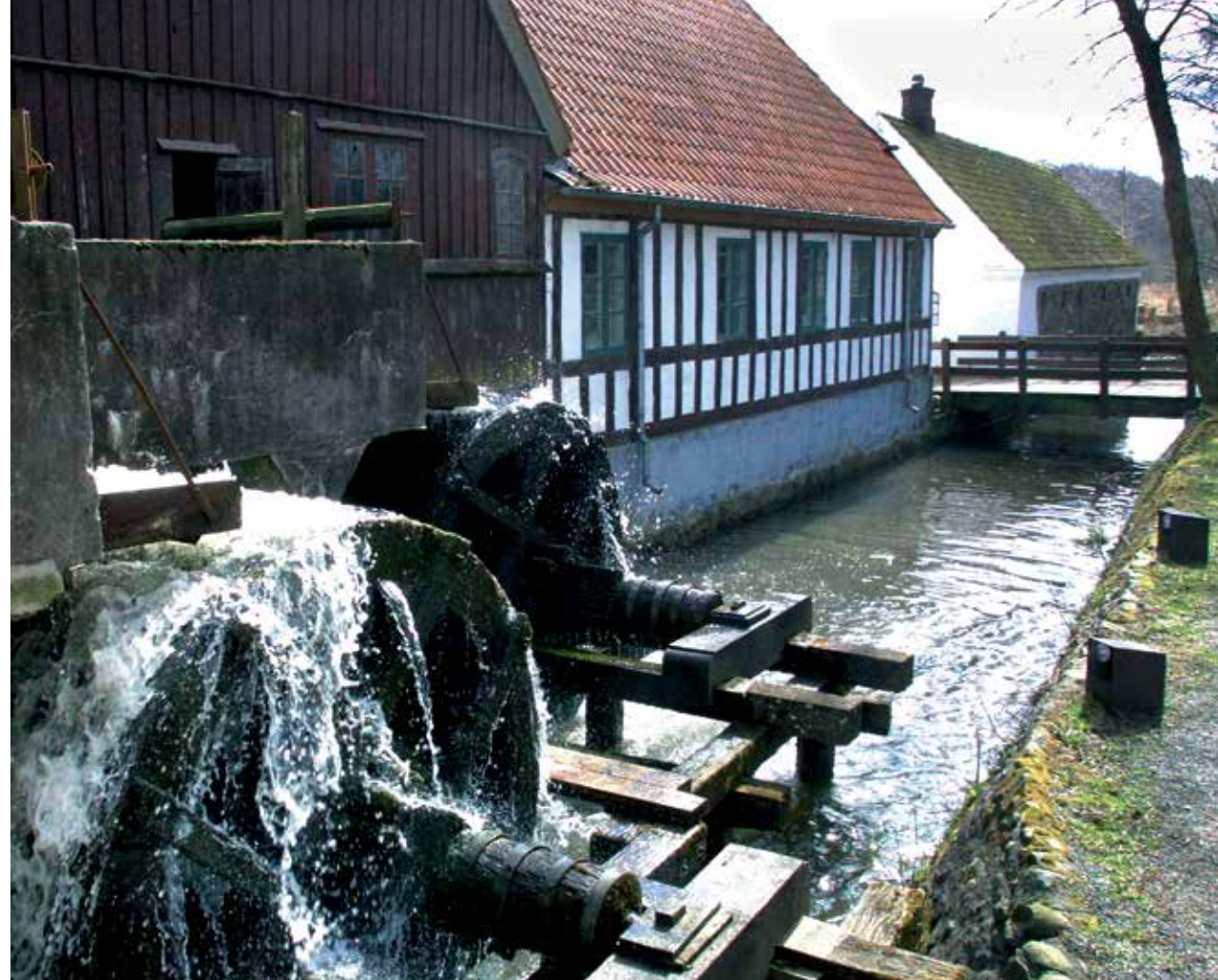
Vandmøllens hjul på arbejde - som kraften, der får hele mølleriet til at virke.

Og det hed sig også i folkemunde, at en falden kvinde kunne blive jomfruelig ren igen, hvis hun tog bad i en ærlig møllers dam.