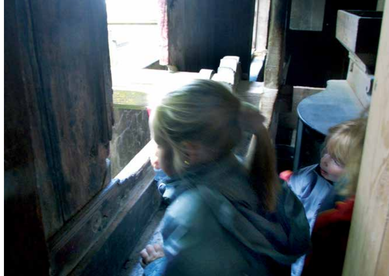
Børn er et medlevende og interesseret publikum, når de besøjer Børkop Vandmølle, og de skal helst undersøge og kigge ud gennem alle sprækker.